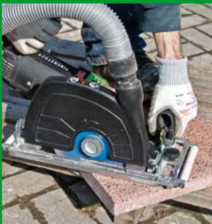
Betonwerkstein – Terrassenplatten hier: Trockenschnitt