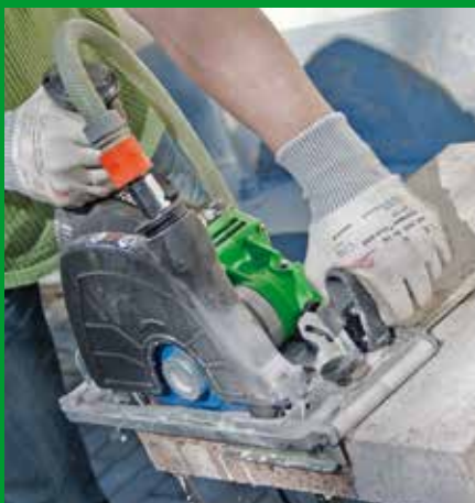
Naturstein-Setzstufe kürzen hier: Nassschnitt mit Winkelanschlag

Winkelanschlag – einfaches Ablängen unabhängig der Werkstückgröße