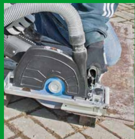
Betonborde im Galabau hier: Trockenschnitt