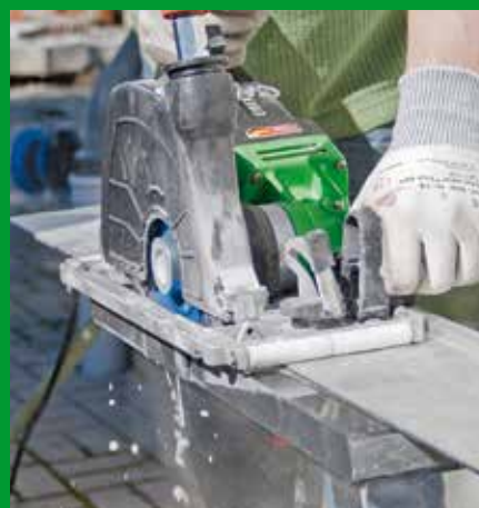
Naturstein-Küchenarbeitsplatte ablängen hier: Nassschnitt mit Führungsschiene