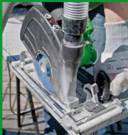
Natursteinfensterbank – Tropffuge hier: Trockenschnitt mit Eintauchtiefenbegrenzung