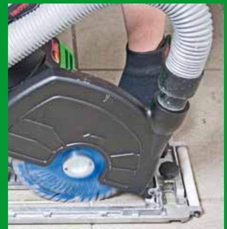
Fugensanierung hier: Trockenschnitt mit Eintauchtiefenbegrenzung