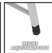
HEIGHT ADJUSTABLE FOOT