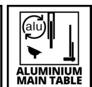
ALUMINIUM MAIN TABLE