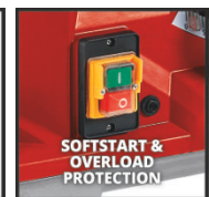
SOFTSTART & OVERLOAD PROTECTION