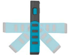
180° Schwenkbar/180° degree