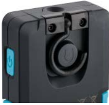
Magnet / Magnet