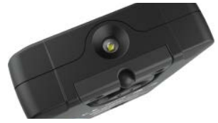
Top Licht / Top lamp