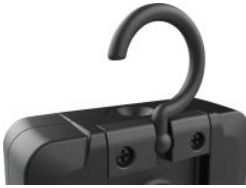
Haken / Hook