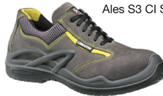
Ales S3 CI SRC