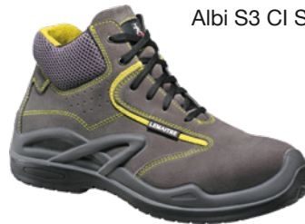
Albi S3 CI SRC