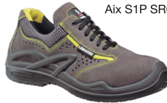
Aix S1P SRC