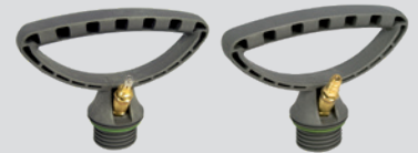
Druckluftfüllventil (6209NA und 6209NB)