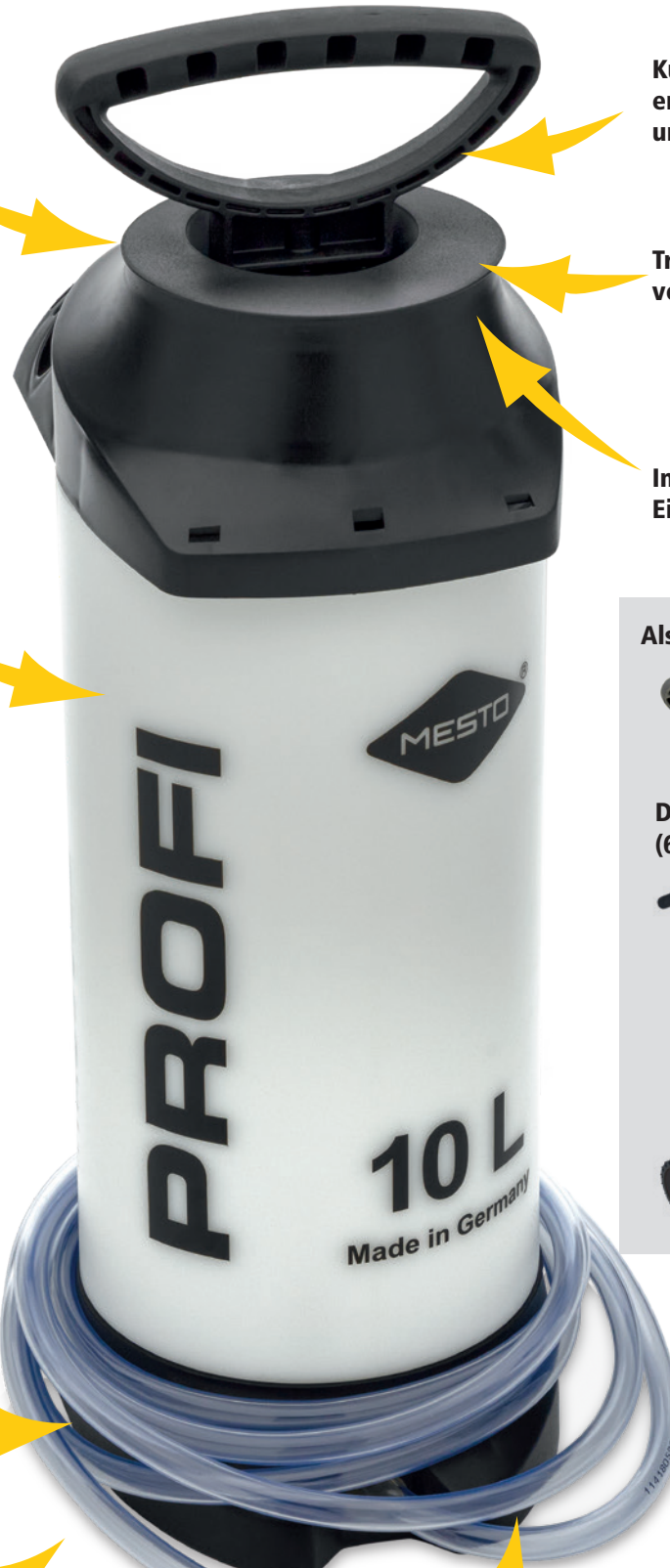
Kunststoffpumpe mit ergonomischem Pumpengriff und Stahlkolbenstange