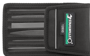
72230001 12800 SCHLUESSELFEILENSATZ Schlüsselzeilensatz L.100 mm 6tlg.