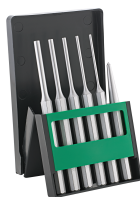
96700711 105-8/6 K SPLINTTREIBER- UND KOERNERSATZ Splinttreiber- u.Körnersatz 6tlg.