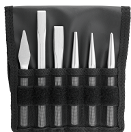
98812203 102-5/6 T MEISSEL- UND KOERNER-SATZ Satz Meißel, Durchtreiber, Körner Nr.102-5/6 T 6tlg.