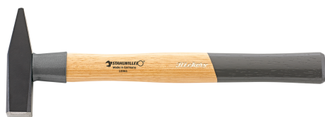
70110010 10961 300 G SCHLOSSERHAMMER Schlosserhammer 300 g L.300 mm