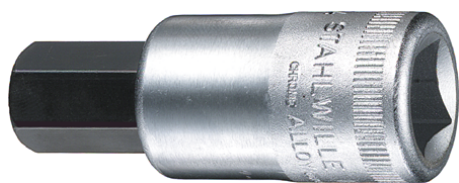
03050004 54 4 12,5 mm (1/2") INHEX-Einsatz 4 mm L.60 mm