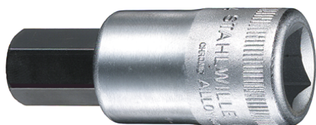
03050010 54 10 12,5 mm (1/2") INHEX-Einsatz 10 mm L.60 mm