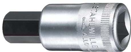
03050012 54 12 12,5 mm (1/2") INHEX-Einsatz 12 mm L.60 mm