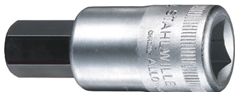
03050006 54 6 12,5 mm (1/2") INHEX-Einsatz 6 mm L.60 mm