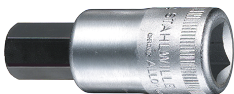
03050008 54 8 12,5 mm (1/2") INHEX-Einsatz 8 mm L.60 mm