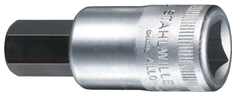
03050005 54 5 12,5 mm (1/2") INHEX-Einsatz 5 mm L.60 mm