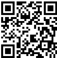
Tabla de contenidos

Introduzca el número de fabricante (903065) en el campo de búsqueda.