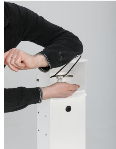
Abb. Bedienung des Handdesinfektionsspenders